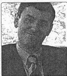
Viganò, vice direttore generale: «Abbiamo lavorato in stretto contatto con l'Aipa»